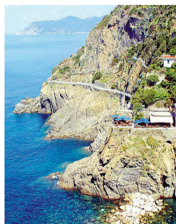
MEMORIA La Via dell'Amore

Proseguì, ma, fatti pochi passi, udii alle mie spalle una voce femminile bisbigliare nervosamente: «Non è lui, ti dico. Stai tranquilla e passa piuttosto, scema!». Poi, di nuovo, silenzio assoluto. D'improvviso, avvertii un intenso odore orientaleggiante, come di curry e sandalo mischiati. Chiedendomi da dove provenisse, mi voltai e vidi un puntolino rosso muoversi orizzontalmente, simile a una grossa lucciola. Mi fermai a guardarlo, protetto dall'oscurità. Ora il puntolino, immobile, divenne per un attimo più luminoso, poi si spostò di nuovo verso destra, ma un po' più in basso. E di nuovo parve infiammarsi, per poi tornare verso sinistra. E di nuovo una zaffata di quel penetrante profumo esotico. Una risata maschile risuonò, alta e volgare. Allora mi prese una sottile inquietudine. Non me la sentivo né